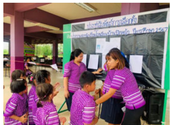
กิจกรรมส่งเสริมประชาธิปไตย เลือกตั้งสถานักเรียน