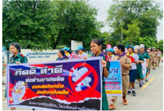
กิจกรรมรู้เท่าทันยาเสพติด (เดินรณรงค์ต่อต้านยาเสพติด เนื่องในวันต่อต้านยาเสพติดโลก)