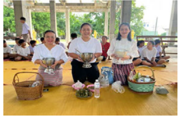
กิจกรรมวิถีไทย วิถีพุทธ (สวมใส่เสื้อขาวไปทำบุญตักบาตรในวันพระ)