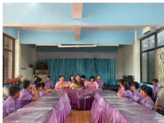
ภาพแสดงการประชุมวางแผนงานและร่วมสร้างความเข้าใจในการดำเนินงานฯ