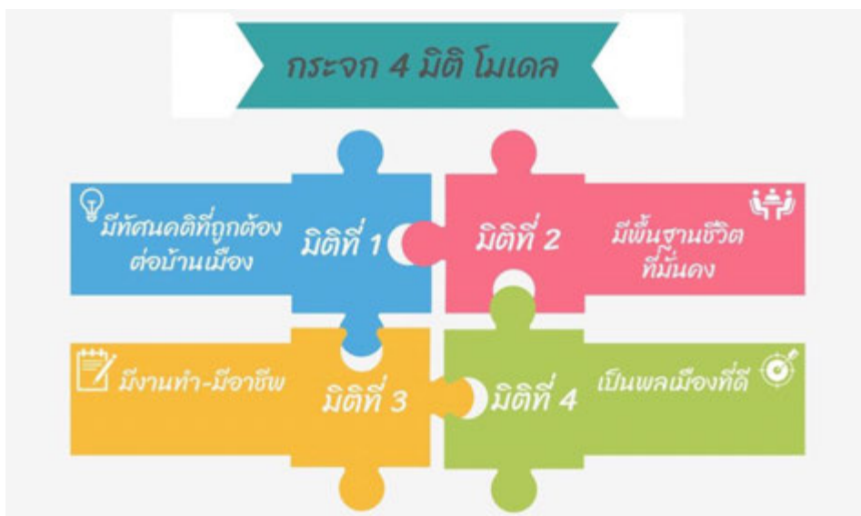
แผนภาพแสดง กระบวนการกระจก ๔ มิติ โมเดล

๑. ดำเนินการพัฒนาคุณธรรม จริยธรรม สร้างสรรค์คนดี ด้วยกระบวนการกระจก ๔ มิติ โมเดล โดยการน้อมนำพระบรมราโชบาย ด้านการศึกษาของในหลวงรัชกาลที่ ๑๐ สู่การปฏิบัติ โดยการจัดกิจกรรม โครงการตามที่วางแผนไว้ ดังนี้