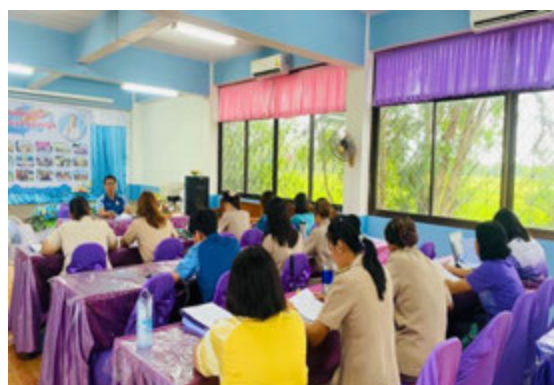
ภาพแสดง การประชุมนิเทศติดตาม ความก้าวหน้าและการประเมินผล/สะท้อนผลกิจกรรม