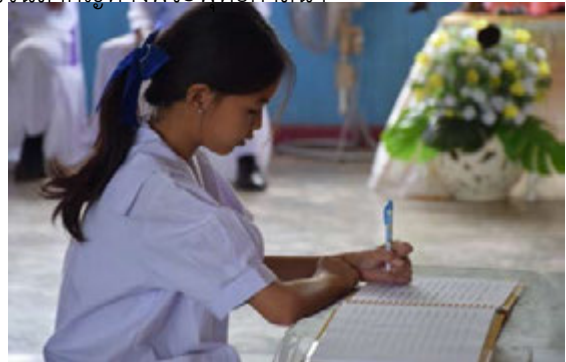
กิจกรรมถวายพระพรชัยมงคลในหลวงรัชกาลที่ ๑๐ แสดงออกถึงความจงรักภักดีต่อสถาบันพระมหากษัตริย์