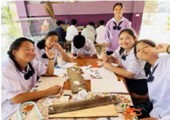
มิติที่ ๓ : มุ่งงานทำ-มีอาชีพ