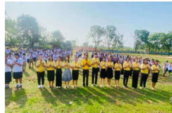
กิจกรรมแสดงสัญลักษณ์ป้องกันการทุจริตทุกรูปแบบ