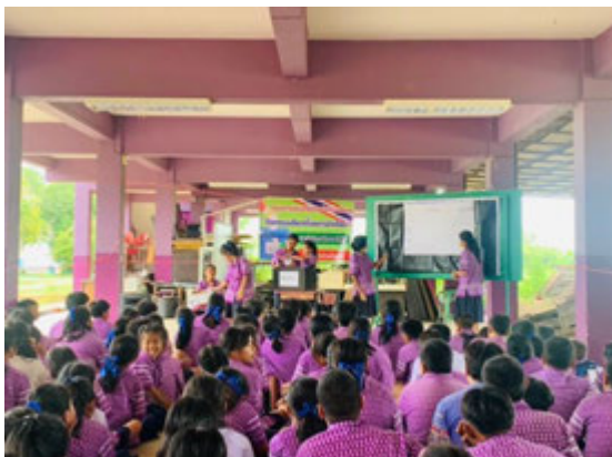
มิติที่ ๑ : มีทัศนคติที่ถูกต้องต่อชาติบ้านเมือง

นอกจากการพัฒนาด้านคุณธรรม จริยธรรม สร้างสรรค์การเป็นพลเมืองที่ดีแล้ว นักเรียนยังได้ตระหนักและสำนึกในพระมหากรุณาธิคุณของในหลวงรัชกาลที่ ๑๐ ที่มีต่อพัฒนาการศึกษา และมุ่งมั่นให้ทุกคนเป็นคนดีของชาติ บ้านเมือง ซึ่งสามารถสรุปเป็นภาพกิจกรรม จากการใช้กระบวนการกระจก ๔ มิติ โมเดล ได้ดังนี้