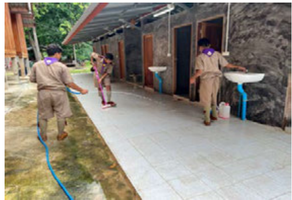
กิจกรรมจิตอาสา เราทำความดีด้วยหัวใจ เพื่อชุมชนและสังคม