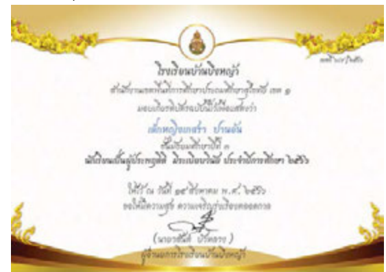
กิจกรรมต้นแบบความดี (นักเรียนต้นแบบความประพฤติดี มีระเบียบวินัย)