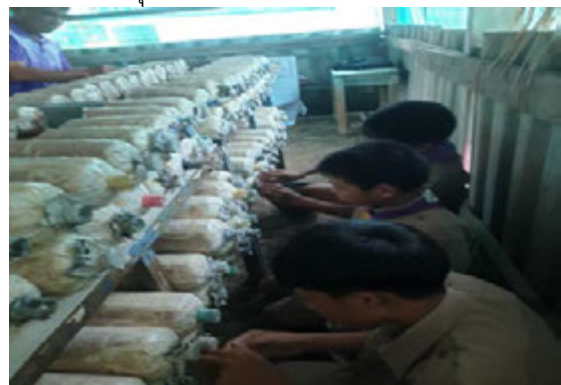
กิจกรรมส่งเสริมการเรียนรู้เศรษฐกิจพอเพียง เพาะเห็ดนางฟ้า