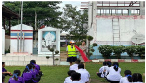
กิจกรรมเรียนรู้กฎจราจร เพื่อให้สามารถปฏิบัติตามกฎระเบียบ กติกา ของสังคม