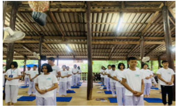
กิจกรรมอบรมศีลธรรม ค่ายพุทธบุตร