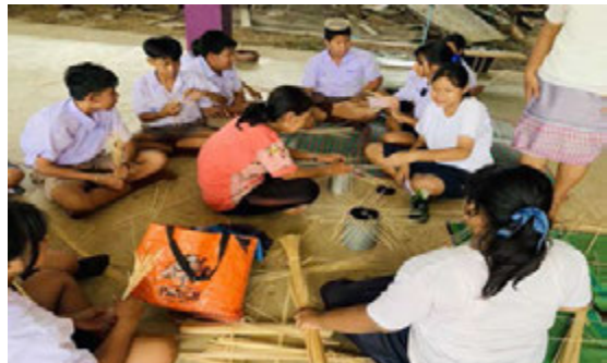
กิจกรรมเรียนรู้ทักษะอาชีพจากปราชญ์ชาวบ้าน การจักสานตะกร้าไม้ไผ่