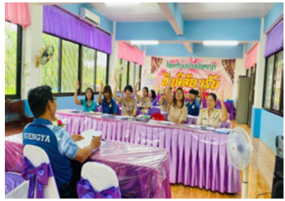
ภาพแสดงการประชุม PLC