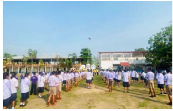
กิจกรรมเข้าแถวเคารพธงชาติ