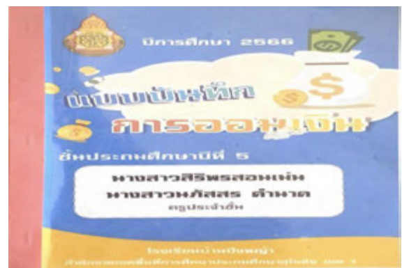
กิจกรรมออมทรัพย์