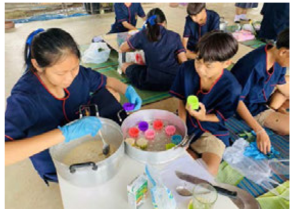
กิจกรรมการจัดการเรียนการสอนสอดแทรกคุณธรรม การทำขนมไทย